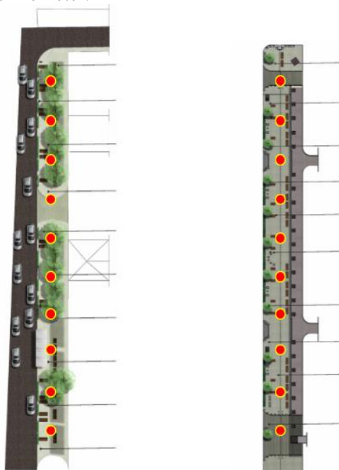
Gambar 2. Titik pengukuran pada tiap area

Pengambilan data dilakukan pada dua hari yang berbeda, masing-masing mewakili kondisi weekday dan weekend. Kemudian di tiap-tiap hari observasi dibagi di dua waktu, yaitu siang hari (interval pukul 11.00-13.00) dan juga sore hari (interval pukul 16.00 – 18.00). Identifikasi objek fisik dilakukan melalui pengamatan, sedangkan data-data iklim diperoleh melalui pengukuran dengan menggunakan alat Environmeter dan Laser Thermometer.