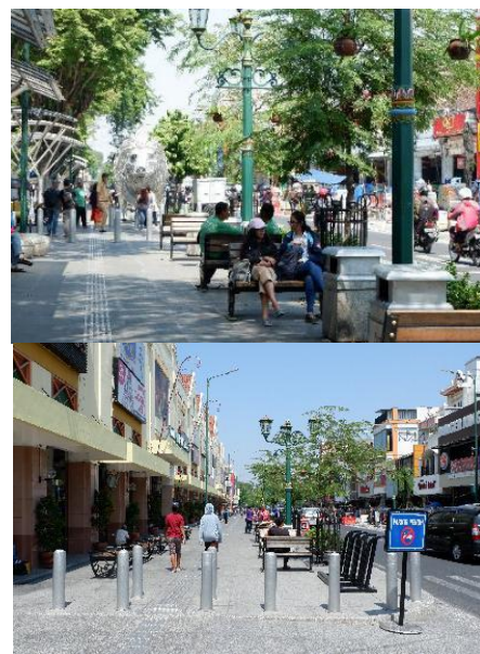
Gambar 3. Suasana lokasi penelitian pada Area I (kiri) dan Area II (kanan)

Namun meskipun memiliki desain ruang yang serupa, terdapat perbedaan yang cukup signifikan di antara kedua area tersebut, terutama pada pelingkup ruang. Area segmen I (di depan Hotel Grand Inna Garuda) memiliki lebih banyak vegetasi dan beberapa memiliki tinggi dan tajuk yang lebar, sehingga area ini memiliki keteduhan yang baik. Sedangkan segmen 2 (depan Mal Malioboro) vegetasi yang ada cukup minim, jika ada masih berukuran kecil sehingga belum bisa memberikan keteduhan pada kawasan. Faktor pembeda lain adalah keberadaan bangunan Mal Malioboro yang langsung menempel pada area pedestrian, sehingga secara jelas menjadi batas dari ruang jalan yang terbentuk. Suasana kedua area dapat dilihat pada gambar 3.