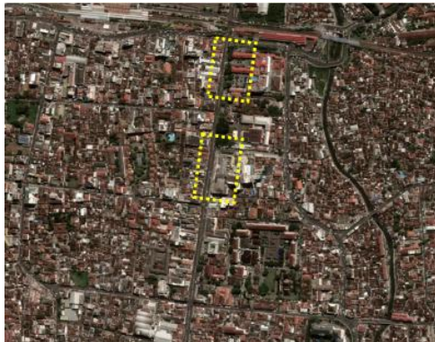
Gambar 1. Lokasi Penelitian

beragam pedagang makanan. Sedangkan area kedua dipilih karena adanya Mal Malioboro (yang ikonik) sebagai salah satu daya tarik kawasan sekaligus pusat aktivitas.